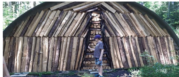
(ins erzgebirgische übersetzt G. Schmidt)

For ne Rundgang brauch't mor ca. 1 bis 1,5 St., un weils ieber Stock un Staa, schmole Waldweg un Treppn auf un ab gieht, is fests Schuwark dorforderlich. Viel Spass bein Dorkundn un vopasst aa net in 1. Taal von Rundgang des wünsch't de Susanne Schlesinger.