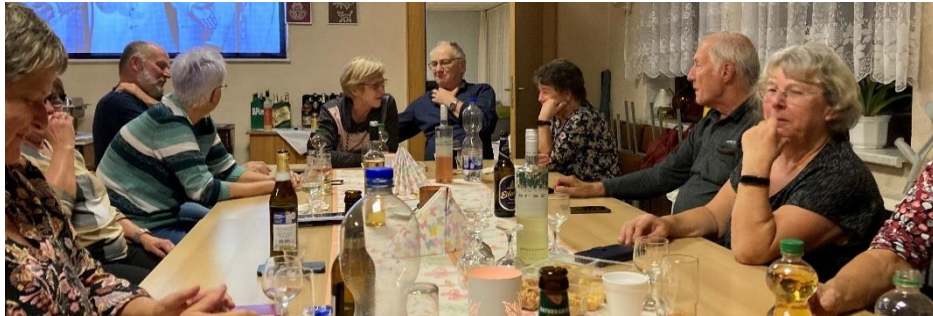
Montagsmorgen um 8 : Korkis Stillgestandn! Die Augen gerade aus!