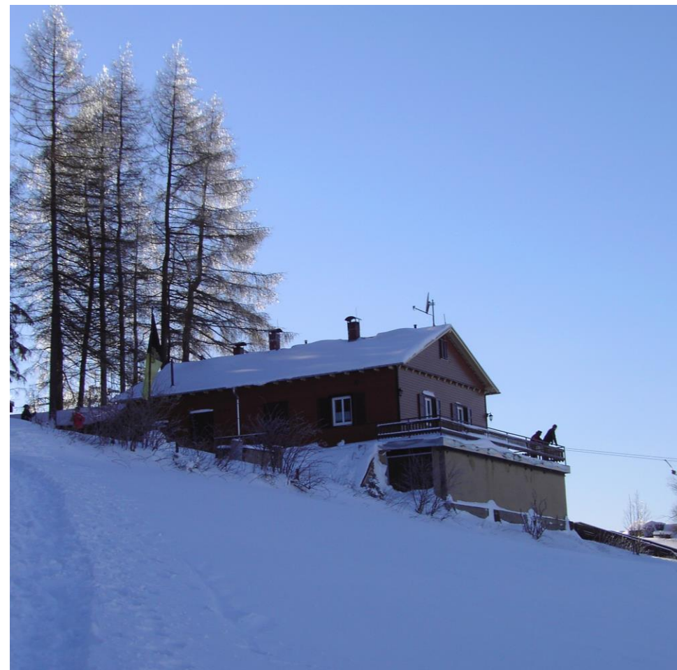
Die Skihütte ist verschneit