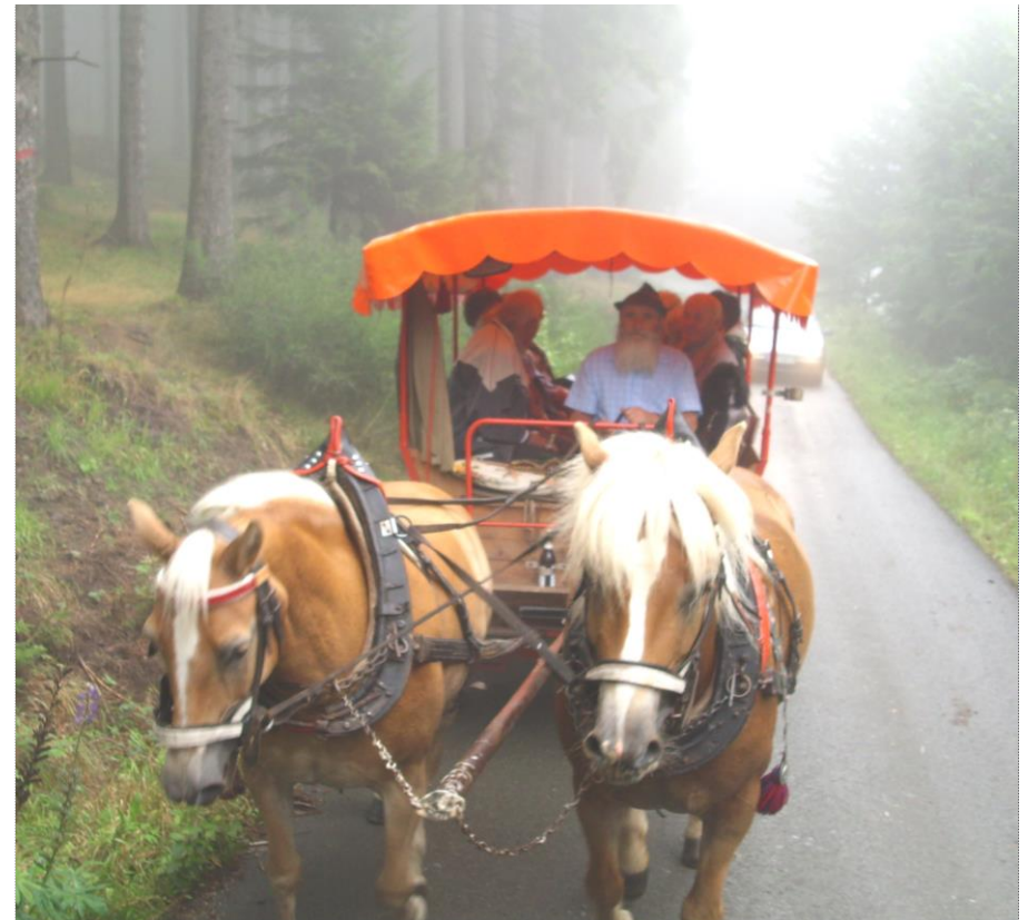
Unner Kramserfahrt im Naabel