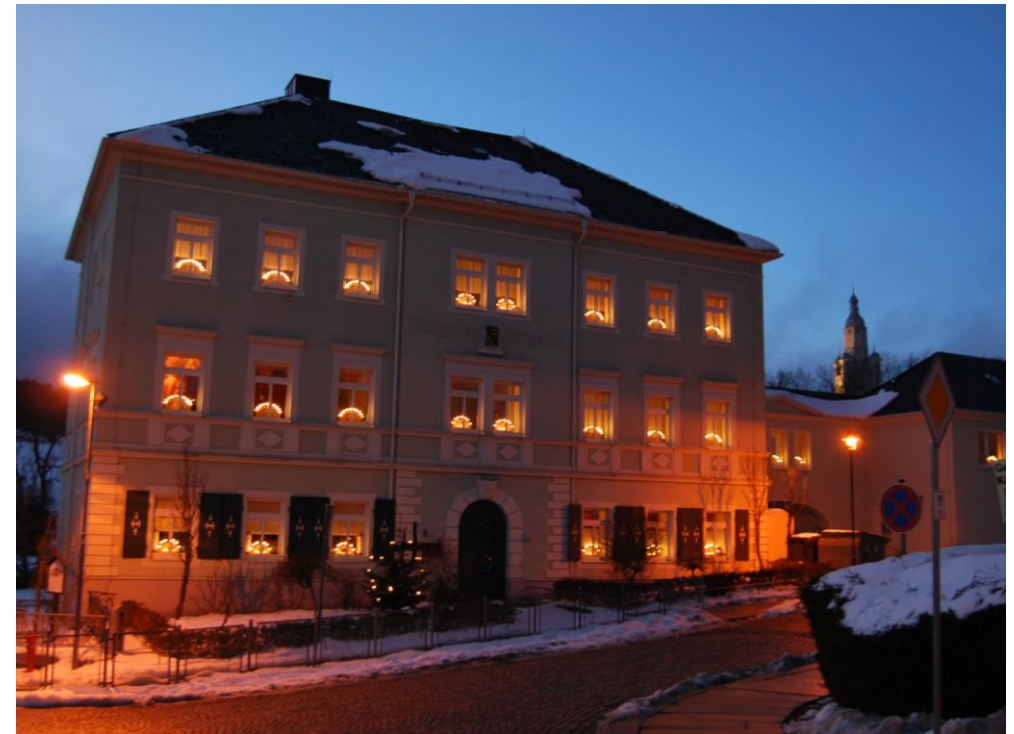
Unner amtsgerichtlicher Kinnergarten