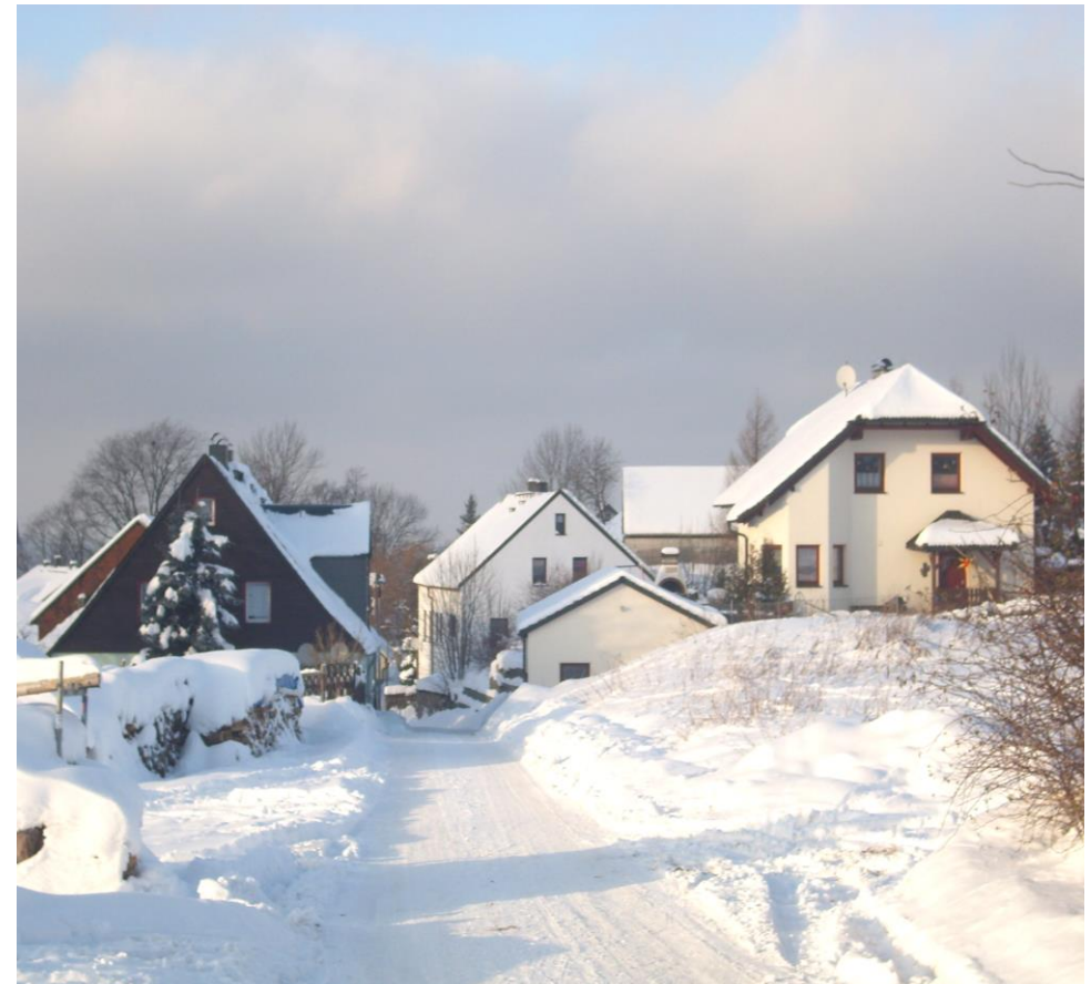
Winter auf dem Hübel