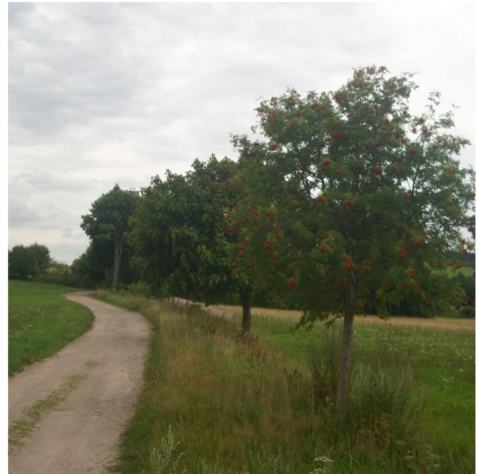
Vogelbeerbaum auf dem Knock in Schönheide