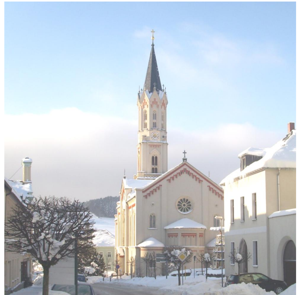
Unsere Stadtkirche im Winterkleid