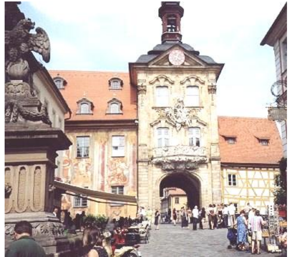
Bamberg – das Ziel unserer Ausfahrt am 3. Oktober 2009 (Altes Rathaus)